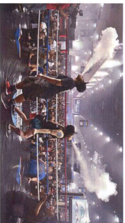
Рис. 2. Вейпинг соревнования

Быстрому распространению курения ЭС (вейпингу) способствуют компании-производители, которые превратили курение ЭС в целую субкультуру. В мире на регулярной основе проводятся субсидируемые компаниями-производителями выставки и соревнования среди курильщиков ЭС (рис.2). Это так называемые: «Cloudchasing» (мастерство выдувания облаков пара), «Tricks» (трюки с паром) и «Вейпинг-алхимия» (соревнования по составлению новых жидкостей для вейпа).