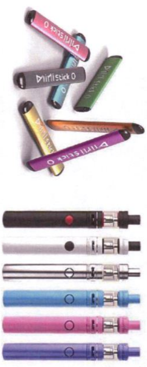
Рис.5. Одноразовые (слева) и многооразовые (справа) электронные сигареты

Одноразовые ЭС рассчитаны на 200 - 500 затяжек пара. В многооразовых устройствах нет таких ограничений и они работают до тех пор, пока доливается жидкость в емкость.