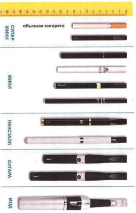
Рис.4. Типы и размеры электронных сигарет

Электронные сигареты (вейпы) классифицируются также по типу и размеру (рис.4) в соответствии с длиной (от 82 мм до 175 мм).