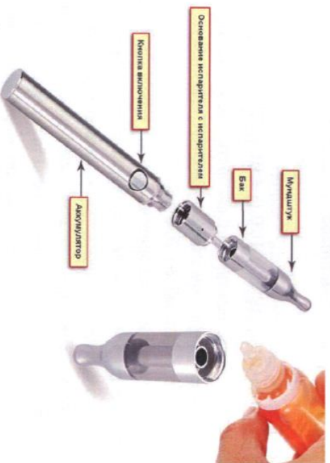
Рис. 3. Устройство электронной сигареты

Обычная электронная сигарета состоит из аккумулятора, электрического испарителя, емкости для жидкости, мундштука и дополнительных элементов для автоматического управления подачей ароматизированной жидкости (но последние имеются не во всех моделях), рис.3.