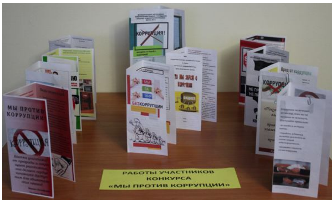
Студенты подготовили буклеты о противодействии коррупции