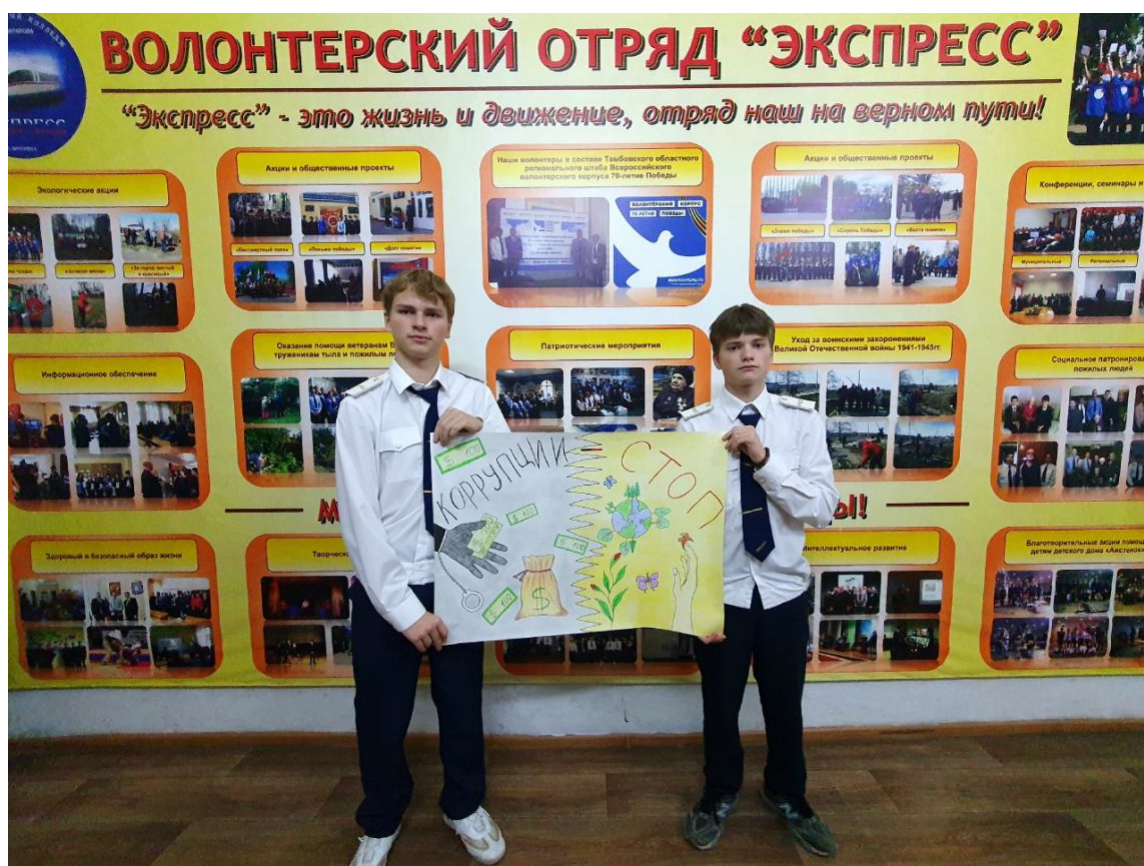
Обучающиеся нарисовали плакат «Коррупции – СТОП»