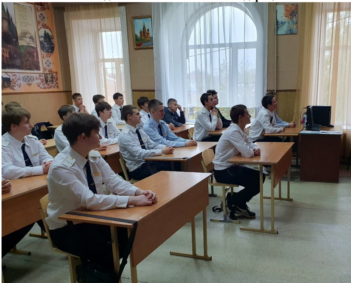
Первокурсники решили ситуационные задачи по предложенным вопросам и поиграли в викторину «Что я знаю о коррупции?»